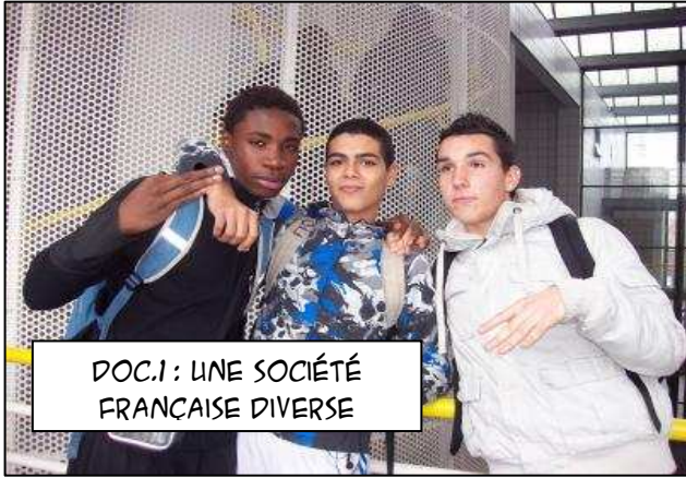
DOC.1 : UNE SOCIÉTÉ FRANÇAISE DIVERSE

AUJOURD'HUI NOUS ALLONS VOIR CE QUE VEUT DIRE « ÊTRE FRANÇAIS » ET COMMENT LE DEVENIR.